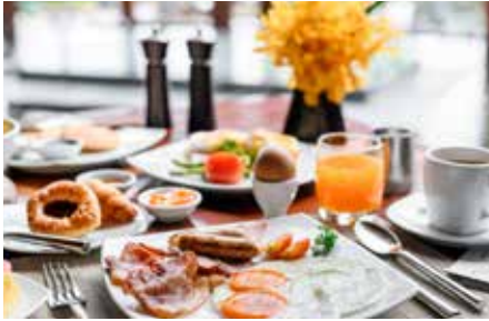
▲ 近隣ホテル等のモーニングも提供

UBUYAMA PLACE の魅力の1つであるレストランのコンセプトは、『ALL DAY PIZZERIA』を掲げ、朝食からディナーまで、それぞれの時間帯に最適かつ多彩なメニューをご用意しております。ナポリピッツァの本場であるイタリアから輸入した薪窯で焼き上げるピッツァを提供するレストランでは、熟練のピッツァイオーロ（ピッツァ職人）が、産山の直営農場のチーズを用いたピッツァをはじめ、カミチグループの事業メリットを活かした、鉄板焼きで味わう生産者直送の黒毛和牛やあか牛のお肉、代官山・中目黒で人気のカフェ『CAFÉ FACON』のスペシャルティコーヒーと出来立てのミルクジェラート、厳選された赤ワインとお肉のマリアージュなどを、澄み渡る青空と緑豊かな草原がどこまでも広がる雄大な自然の中で、ご堪能いただけます。