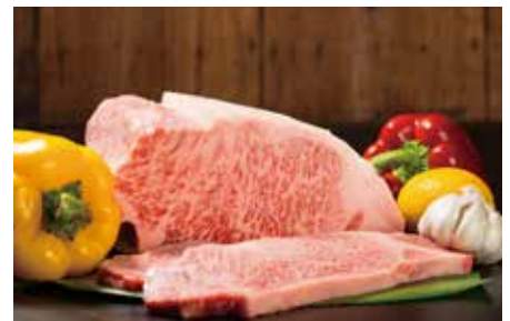
▲一貫体制で育てられた黒毛和牛を味わって