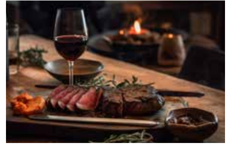
▲ 黒毛和牛とワインのマリアージュを楽しむ