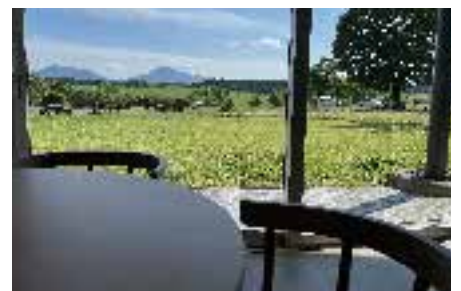
▲ 店内から雄大な自然を見渡せます

UBUYAMA PLACE のリニューアルオープンに伴い、2024年7月7日（日）からオープンイベントを開催します。日頃、大変お世話になっている産山村の方々をはじめ、その関係者に、感謝の意を込めると共に、新しく生まれ変わった UBUYAMA PLACE のお披露目も兼ねて、イタリアから輸入した国内最大級の薪窯で焼き上げるピッツァをお楽しみいただきます。