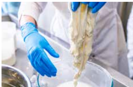
▲新鮮なミルクでチーズを作ります

UBUYAMA PLACE は、カミチクグループの6次産業化によって育まれた、高品質・高付加価値の食材と、「新しい街の創造」を理念にした普遍的な価値を提供し続ける株式会社 MOTHERS が織りなす唯一無二の食体験を通して、食育やフェス、社会貢献やサステナブルな取り組みなどを実施し、九州のへそと言われる産山村から九州各地に広がる「新しい地域共創」の実現を目指します。また、当店を訪れるお客様の入り込みや交流人口の拡大により、地元自治体の産山村が目指す「稼げる村づくり」に貢献していきます。