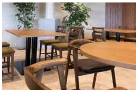
▲ 木を基調とした落ち着いた店内デザイン