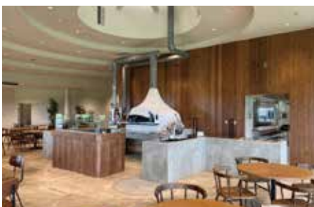
▲ 薪窯で焼いた美味しい焼きたてピッツァを提供