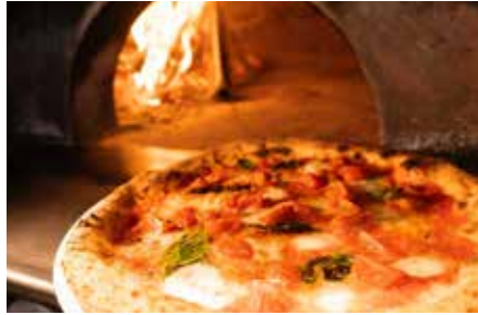
▲ イタリア輸入薪窯で焼き上げる本格的なピッツァ