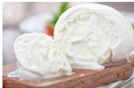
▲ミルク感あふれるモッツアレラチーズ